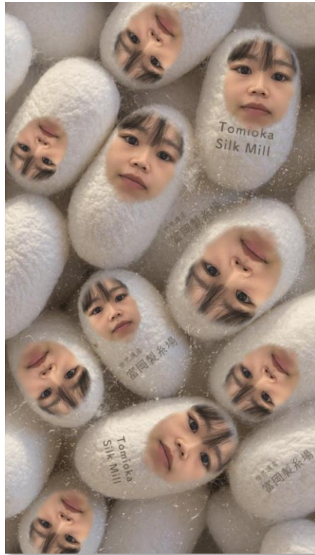
弊社事例：富岡製糸場様