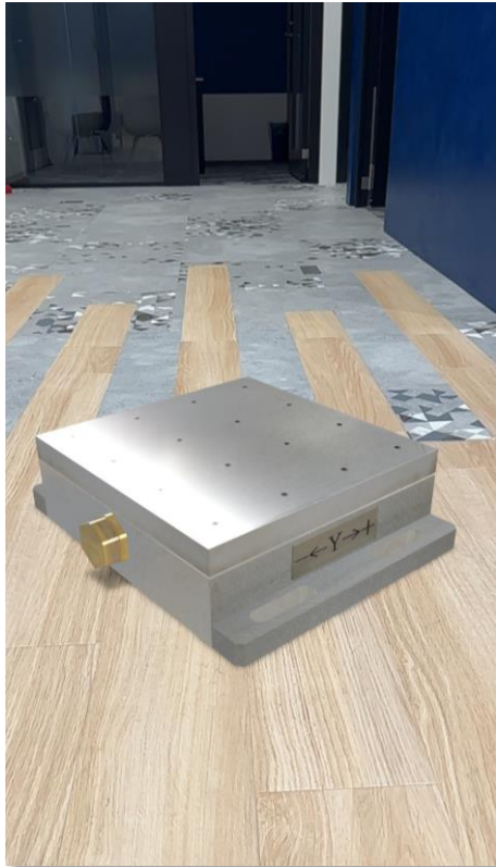
弊社事例：株式会社芝技研様