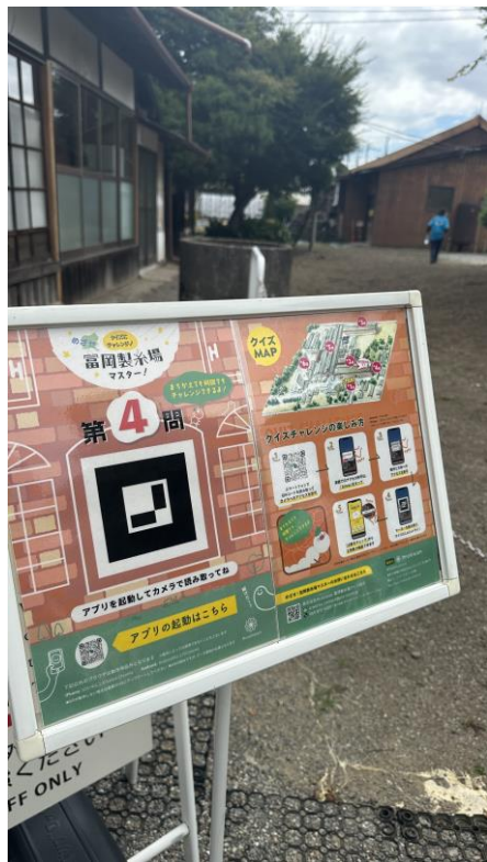
弊社事例：富岡製糸場様